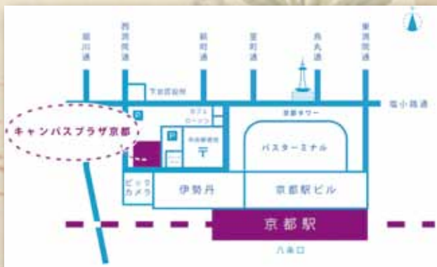
大学コンソーシアム京都(キャンパスプラザ京都内)