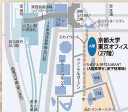
京都大学東京オフィス