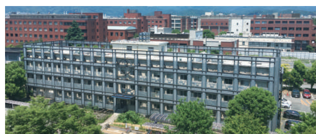
医学部附属病院 先端医療研究開発機構(iACT) iact.kuhp.kyoto-u.ac.jp