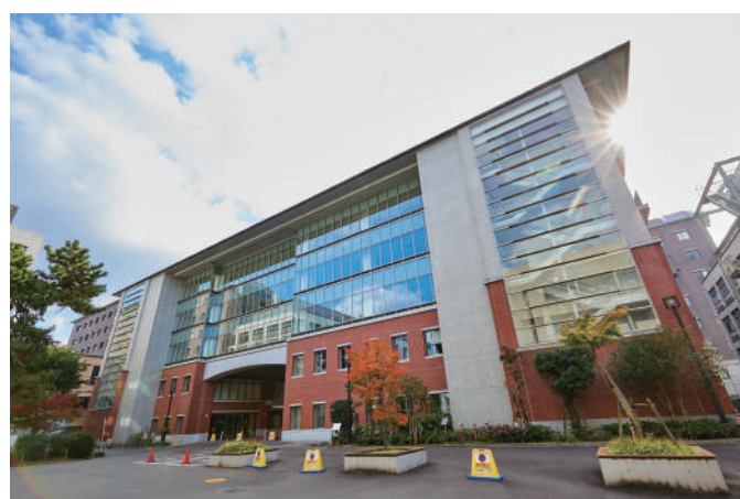
国際科学イノベーション棟(成長戦略本部他)