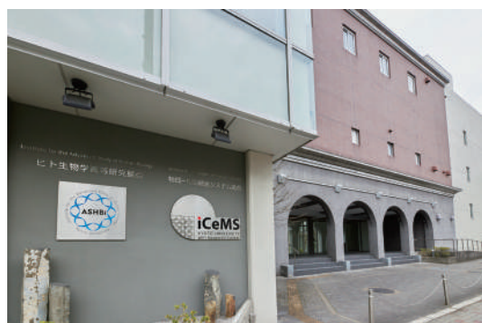
高等研究院(KUIAS) kuias.kyoto-u.ac.jp 物質-細胞統合システム拠点(iCeMS)、ヒト生物学高等研究拠点(ASHBi)