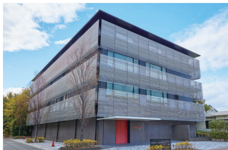
医学部附属病院 先制医療・生活習慣病研究センター