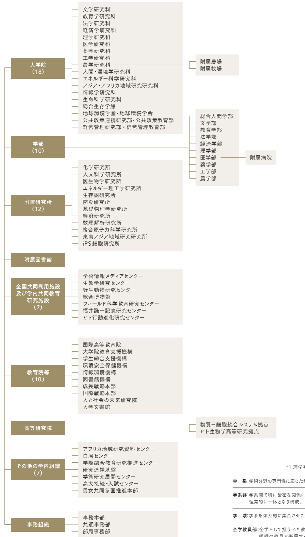
組織図 (令和6年4月1日現在)