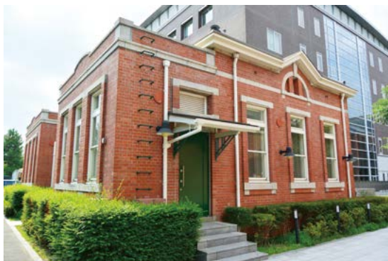
留学生ラウンジ「きずな」外観