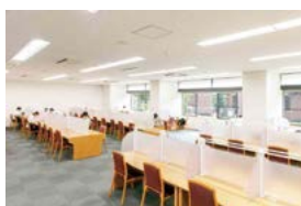
学習室 24 附属図書館にある 24 時間利用できる自習スペースです。