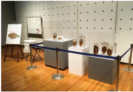
スポット展示「魚の名前 いろいろな和名」