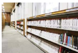
英語学習コーナー 吉田南総合図書館にあり、英語多読・速読のための図書が利用できます。