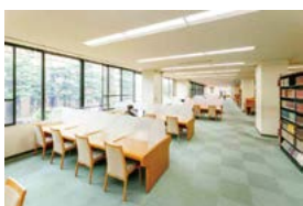
閲覧室 附属図書館の閲覧室にある個人用の閲覧・学習席です。