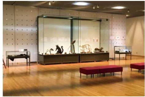
スポット展示「しっぽの秘密」