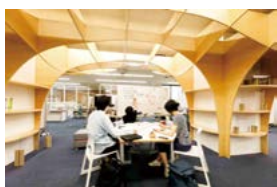
ラーニング・コモンス 附属図書館にあり、グループワークや発表練習等、会話しながら学習できるスペースです。