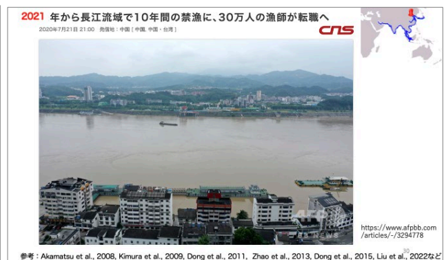
図4 環境悪化に対する大胆な政策例