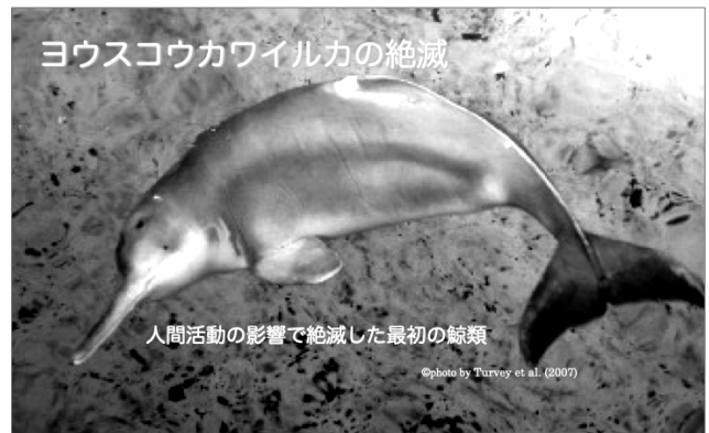
図2 ヨウスコウカワイルカの絶滅