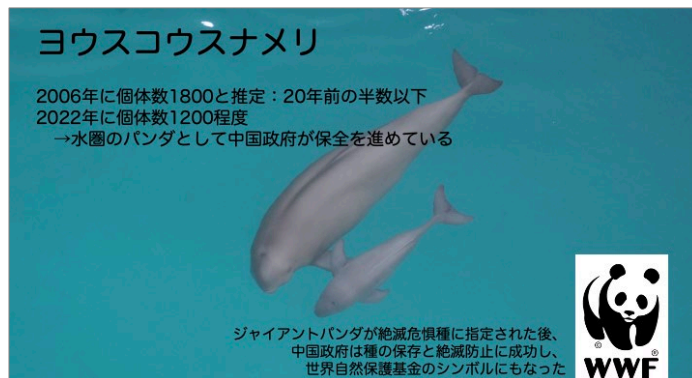
図3 激減するヨウスコウスナメリ