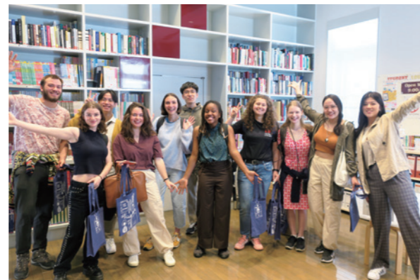
留学生ラウンジきずな「新入交換留学生ウェルカムウィーク」