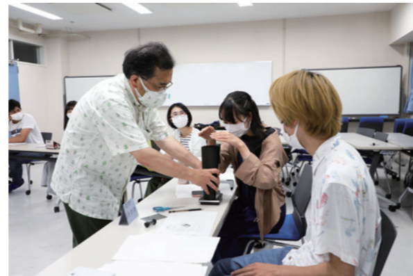
授業風景(ILASセミナー)