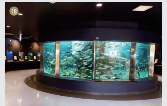
瀬戸臨海実験所(フ)白浜水族館