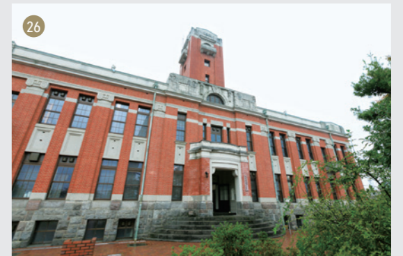
地球熱学研究施設(理)

(理) … 理学研究科 (農) … 農学研究科 (防) … 防災研究所 (野) … 野生動物研究センター (工) … 工学研究科 (生) … 生存圏研究所 (フ) … フィールド科学教育研究センター