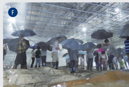
流域災害研究センター 宇治川オープンラボラトリー (防)