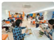
西部生協会館「ルネ」