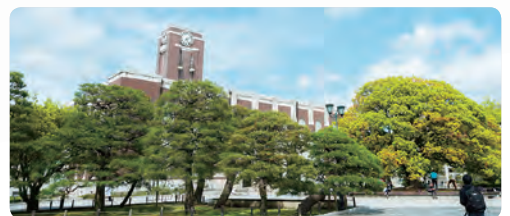
百周年時計台記念館