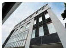
国際高等教育院附属国際学術言語教育センター