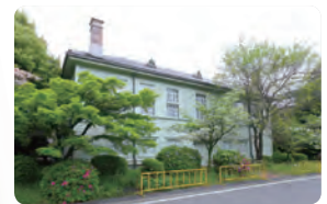
医学部記念講堂・歴史資料館