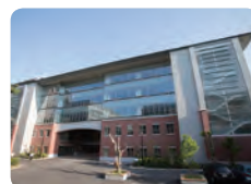
国際科学イノベーション棟