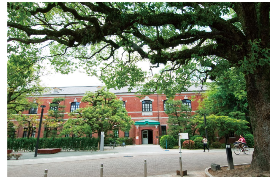
【写真】旧石油化学教室本館（学務部／カウンセリングセンター）

カウンセリングセンターでは、心理学（臨床心理学・相談心理学・青年心理学など）を専門とするスタッフが相談に応じています。現在、1年間に約500人の学生が相談に訪れ、のべ5,000回に上る相談面接がなされています。（カウンセリングセンターの詳細については、ホームページをご覧ください。 http://www.kyoto-u.ac.jp/counseling/ ）