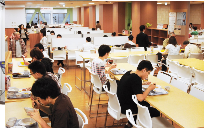
【写真】本部構内中央食堂