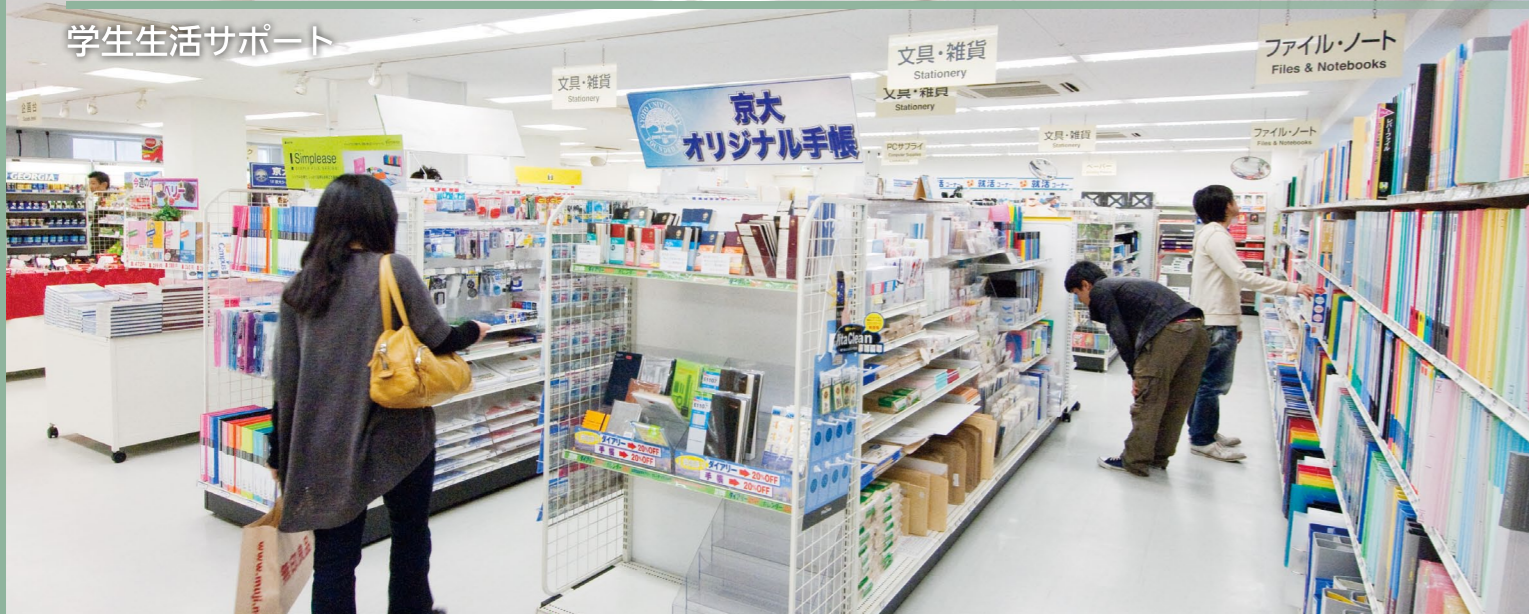
【写真】時計台生協ショップ