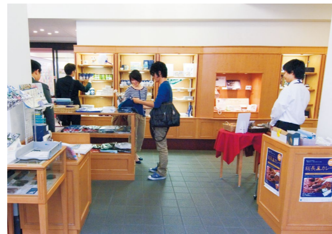
【写真】百周年時計台記念館内にある「京大ショップ」。京都大学オリジナルグッズや京都大学の教員が執筆した書籍が購入できます。