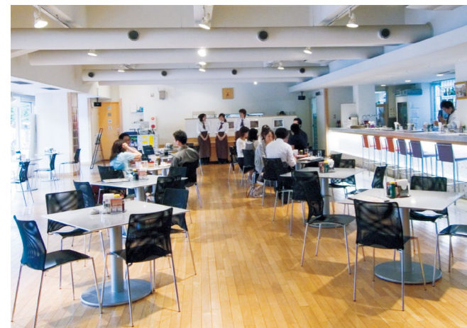
【写真】本部構内の正門横にあるカフェレストラン「カンフォーラ」

※ 2012年8月から2013年3月(予定)まで、西部会館ルネの耐震改修工事のため、カフェテリア「ルネ」は一時的閉店、ショップルネは臨時店舗に移転となる予定です。詳しくは京都大学生協ホームページ http://www.s-coop.net をご覧ください。