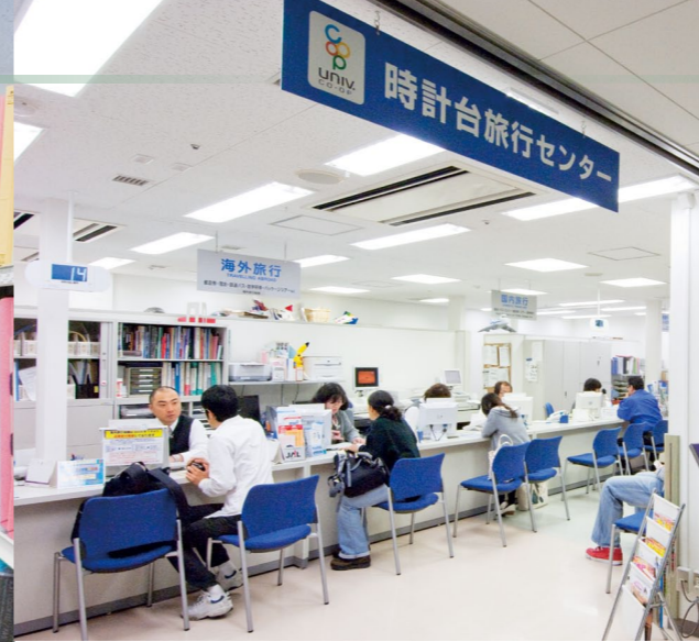
【写真】時計台旅行センター