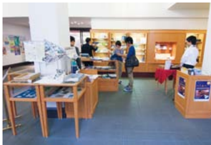
【写真】 百周年時計台記念館内にある「京大ショップ」。 京都大学オリジナルグッズや京都大学の教員が執筆した書籍が購入出来ます。