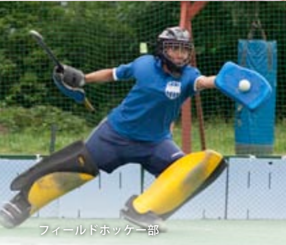
フィールドホッケー部