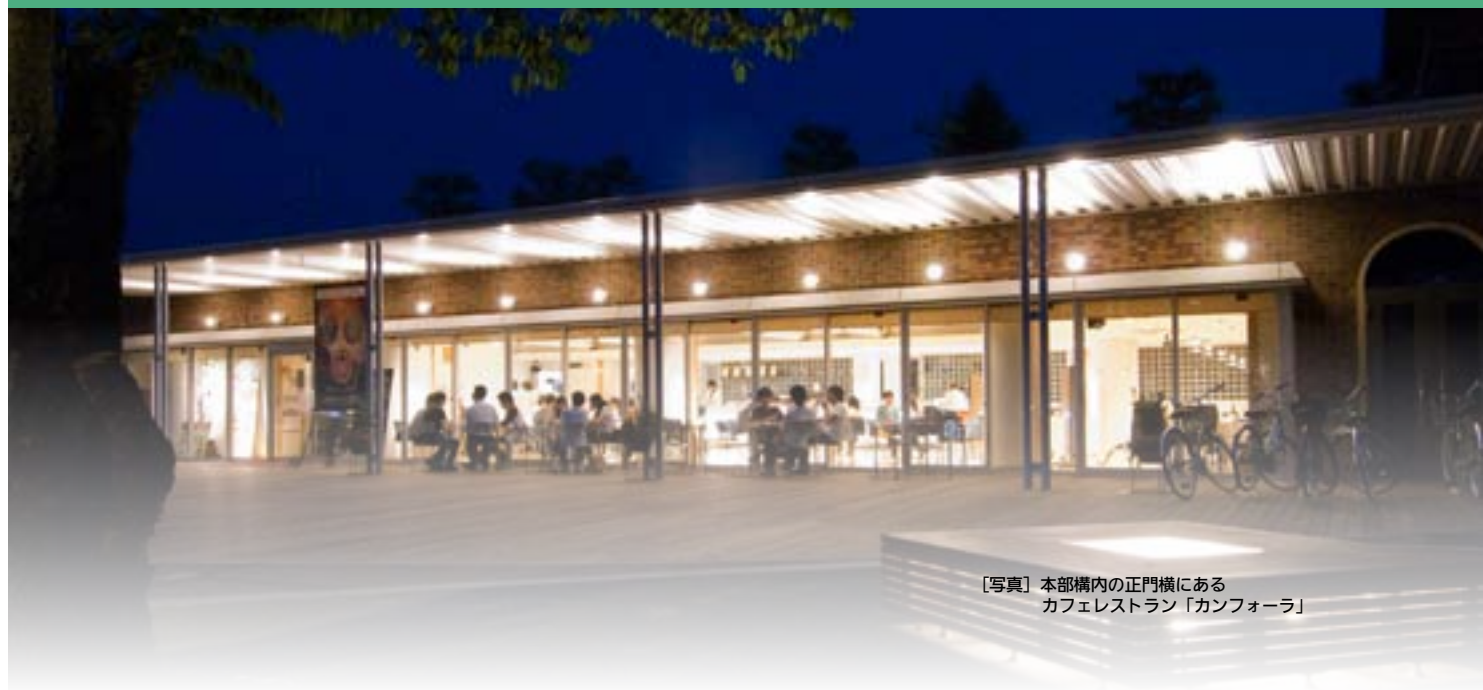
【写真】 本部構内の正門横にある カフェレストラン「カンフォーラ」