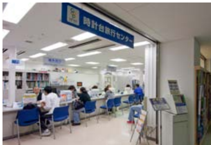
【写真】 時計台旅行センター

ほかに、京都大学オープンキャンパスでのキャンパスツアー開催や各種相談コーナーの運営などを通して、これから京都大学を目指す人たちへのサポート活動にも力を入れています。