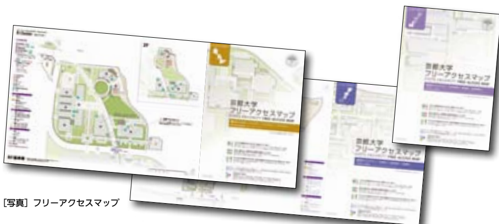
【写真】フリーアクセスマップ

障害学生支援室 Support Office for Disability Students