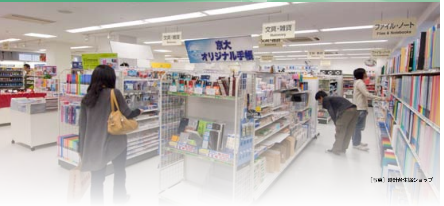
[写真] 時計台生協ショップ